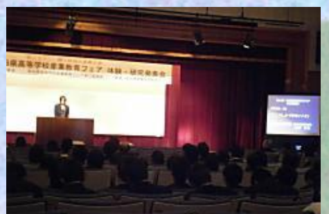
秋田県産業教育フェア体験・研究発表会