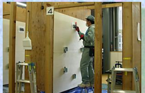
ものづくりコンテスト