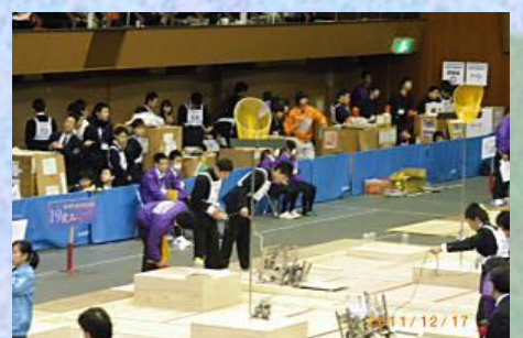
全国高等学校ロボット競技大会